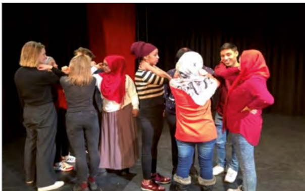
Eigene und fremde Wertevorstellungen werden beim Theaterbesuch reflektiert