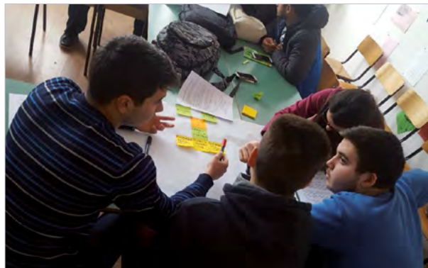
Die Werte-Toolbox bietet eine systematische Unterstützung bei der Analyse von Werten