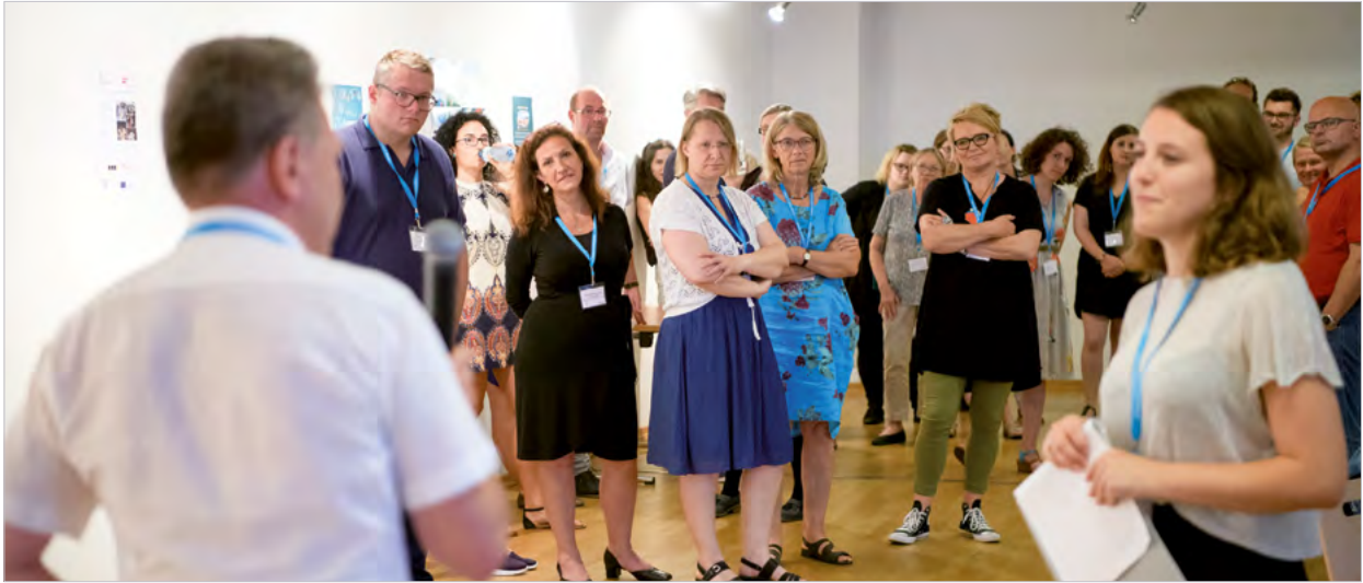
Bei einer soziometrischen Aufstellung positionieren sich die Teilnehmer/innen zu Konzeptionen der politischen Bildung