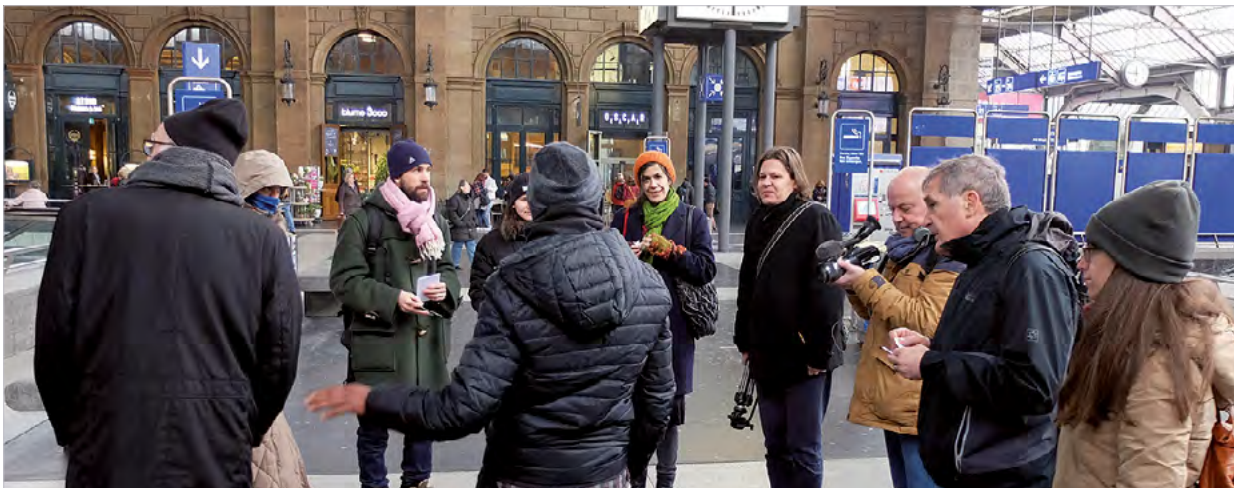
Zürich - die Stadt aus der Sicht eines Flüchtlings, organisiert von Architecture for Refugees